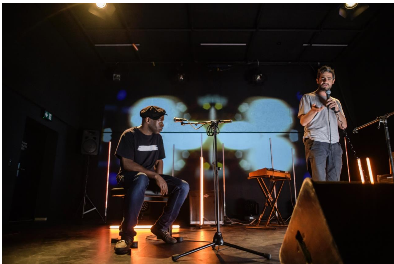
Radio Ghosts, répétitions

Création du 22 septembre au 9 octobre 2022 au Théâtre Vidy-Lausanne