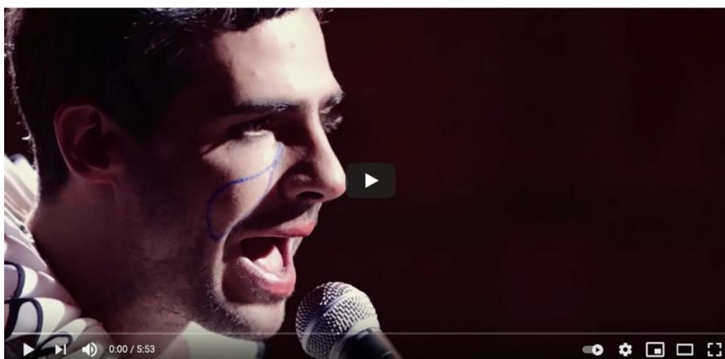
Mister Milano - Il buffone