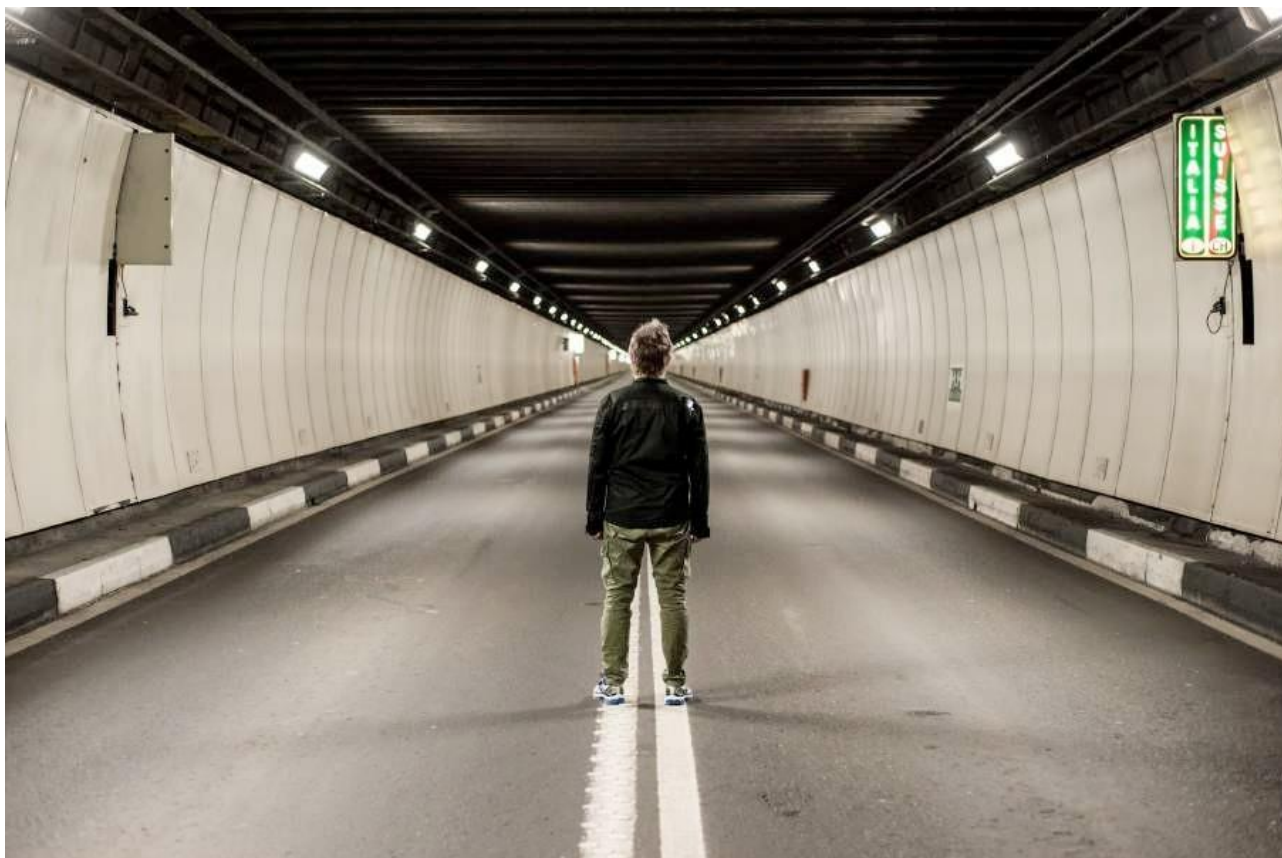
Tunnel, 3 mars 2015 - Performance au Grand S-Bernard (CH)/ © Pierre Nydegger.